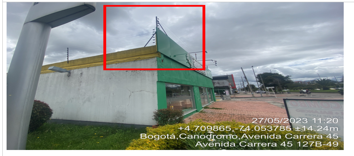
Fotografía No. 3

En la cual se evidencia la fachada del establecimiento comercial ANIMAL S LTDA, propiedad de la sociedad ANIMAL S LTDA, en la que se observa: un (1) elemento publicitario identificado con el número 1 con orientación visual sobre la AK 45, y un (1) elemento publicitario identificado con el número 2 con orientación visual sobre la CL 127 B Bis los cuales están volados de la fachada del establecimiento comercial, así mismo tres (3) elementos PEV identificados con los números 3,4 y 5 con orientación visual sobre la AK 45 y dos (2) elementos PEV identificados con los números 6 y 7 con orientación visual sobre la CL 127 B Bis, los cuales se encuentran ubicados en las ventanas de la edificación.